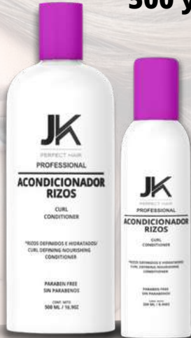
Acondicionador Rizos 500 y 250MI