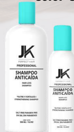
Shampoo Anticaída Color 500 y 250 MI