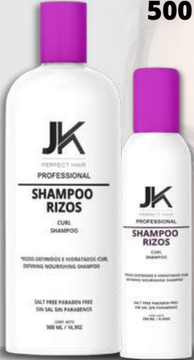
Shampoo Rizos 500 y 250MI