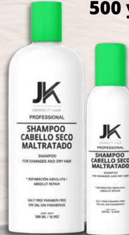
Shampoo Cabello Seco Maltratado 500 y 250MI