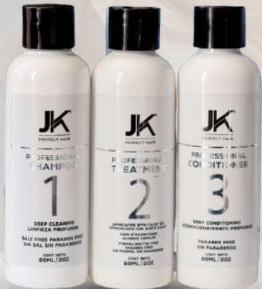
KIT 60 ML