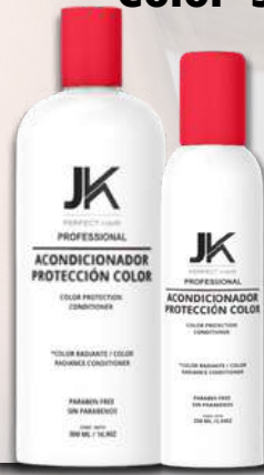
Acondicionador Protección Color 500 y 250 MI