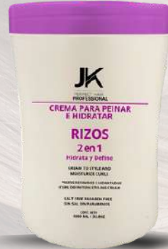
Crema para peinar Rizos 1.000 ml