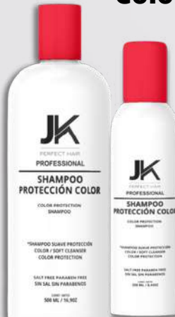
Shampoo Protección Color 500 y 250 MI