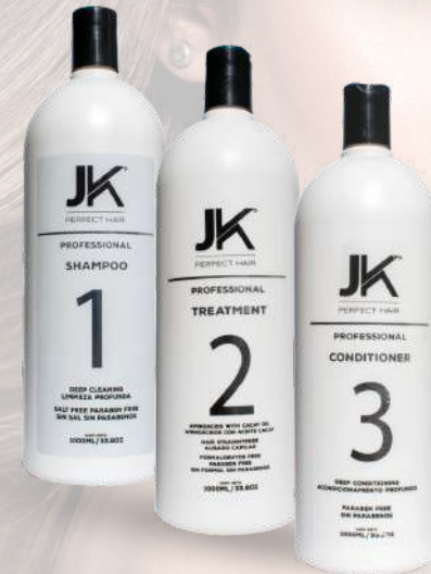
KIT 1.000 ML