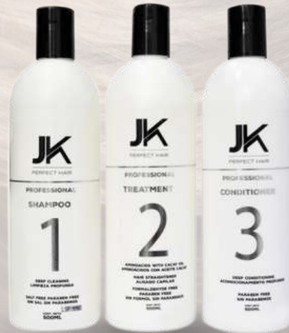
KIT 500 ML