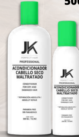
Acondicionador Cabello Seco Maltratado 500 y 250MI