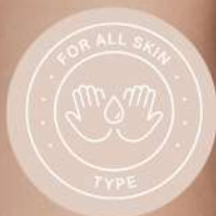
Todo tipo de piel