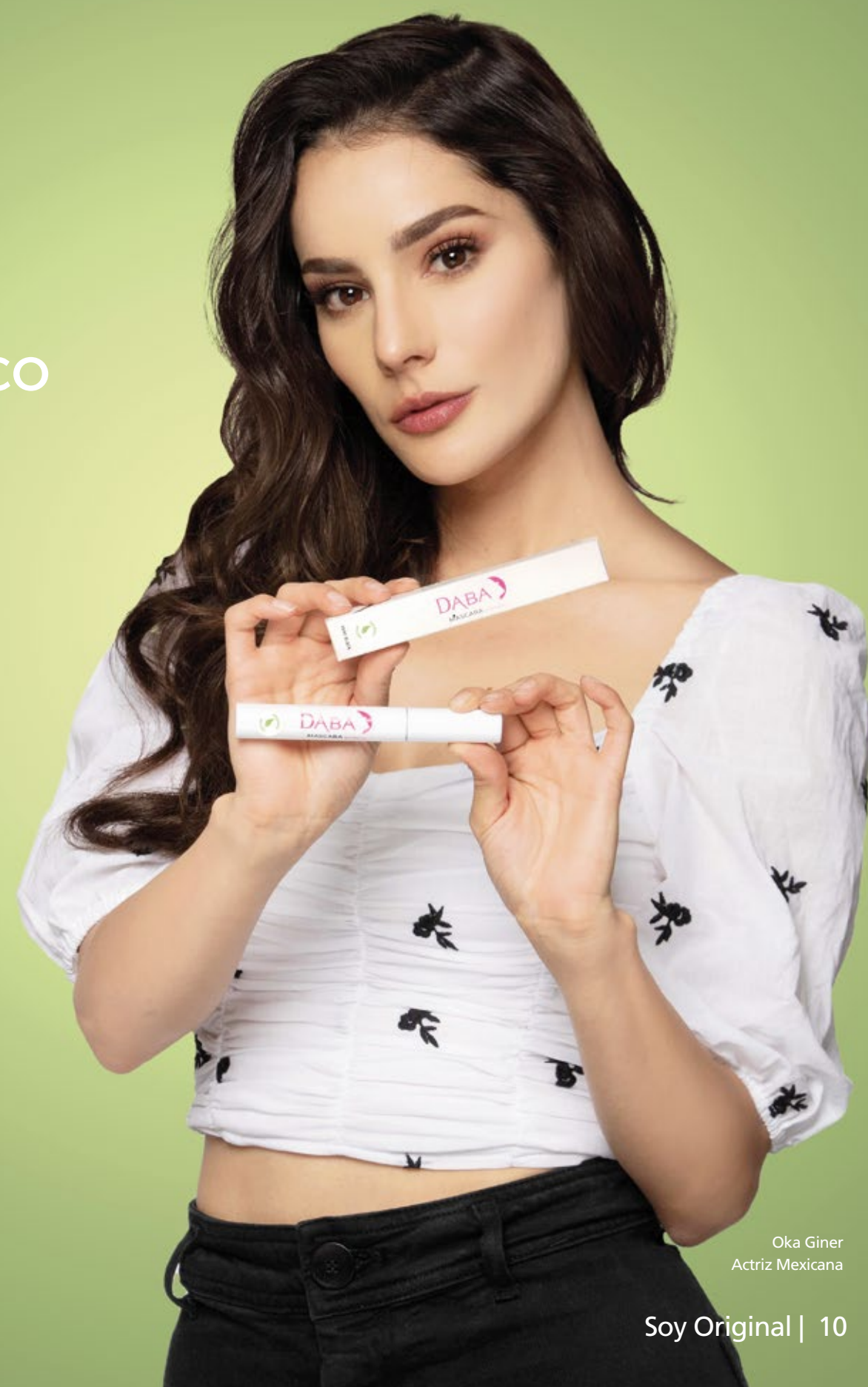
Oka Giner Actriz Mexicana