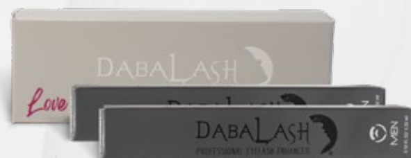
DABALASH Men +DABALASH Men