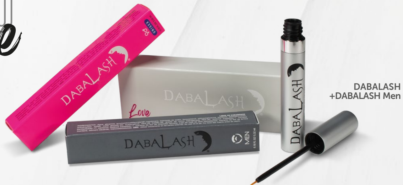
DABALASH +DABALASH Men