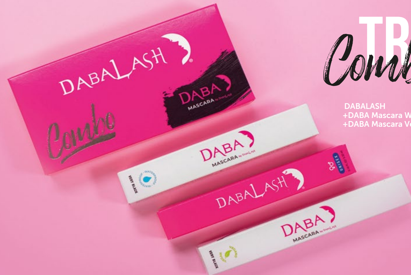
DABALASH +DABA Mascara Waterproof +DABA Mascara Vegana