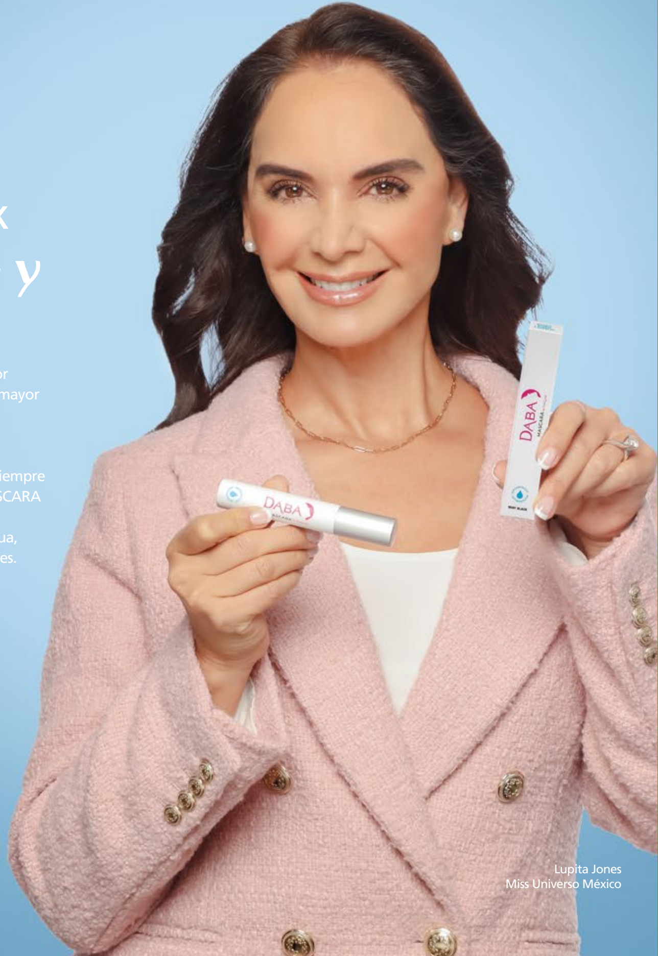
Lupita Jones Miss Universo México