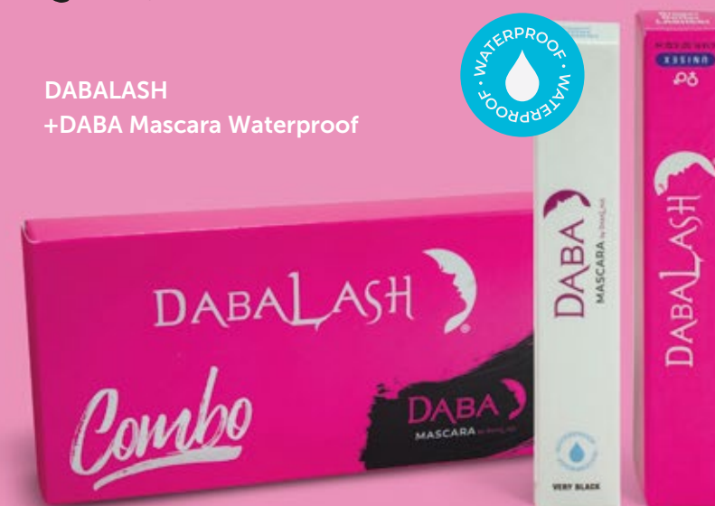
DABALASH +DABA Mascara Waterproof