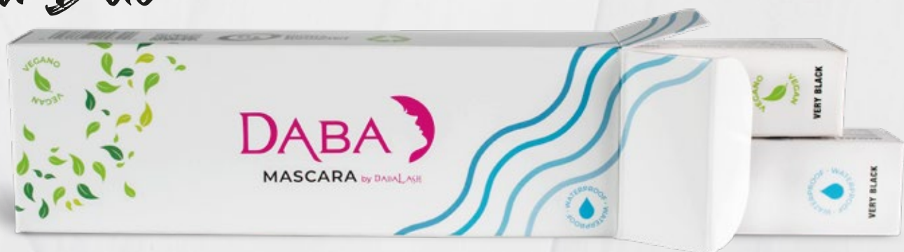
DABA Mascara Waterproof + Vegana