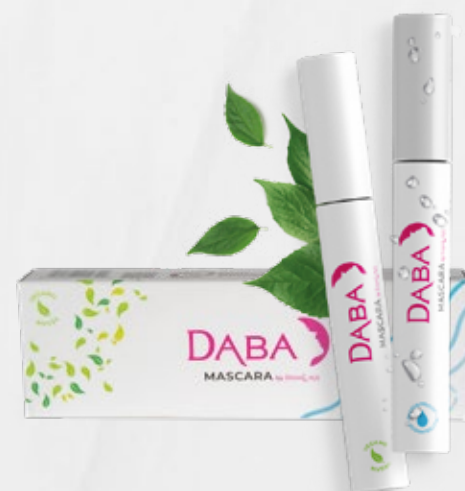
COMBO DABA DUO