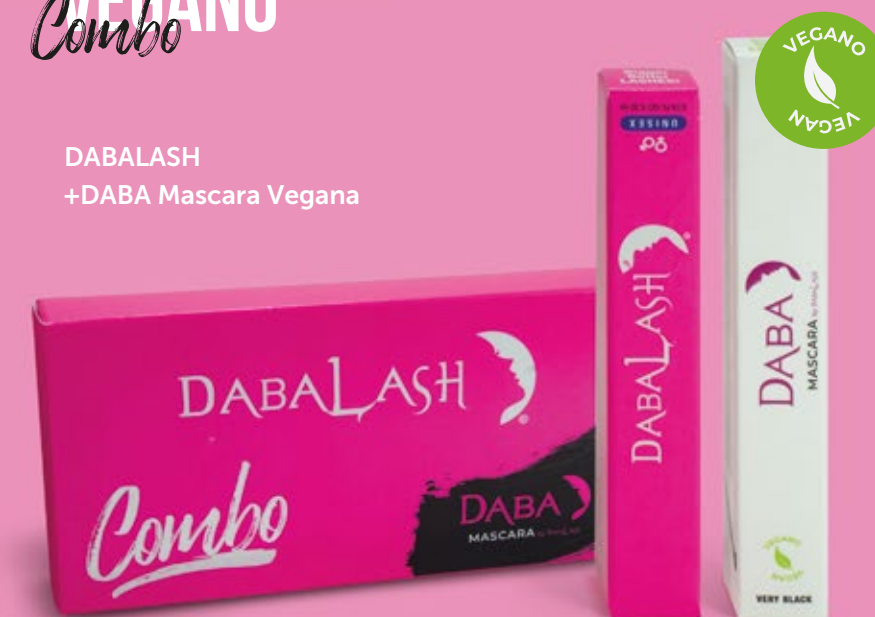
DABALASH +DABA Mascara Vegana