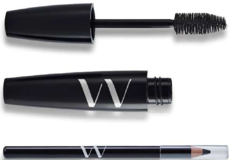
Duo Pestañina Lavable + Lápiz Negro