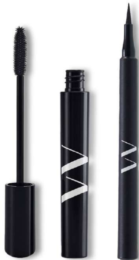
Duo Pestañina Waterproof + Plumón