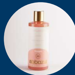
Shampoo - Ella

Única y de alta calidad que combina ingredientes excepcionales con tecnología avanzada como Minoxidil, Trichogen y extractos naturales de romero, aloe vera, linaza y ginseng, adaptándose a las diversas necesidades del cabello para ofrecer resultados notables y visibles.