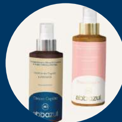
Tónico capilar - Él y Ella