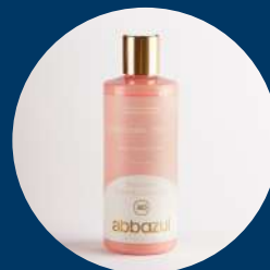
Acondicionador - Ella