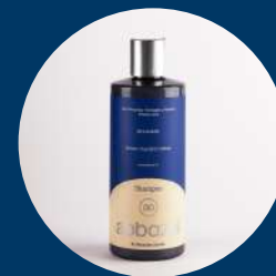
Shampoo - Él