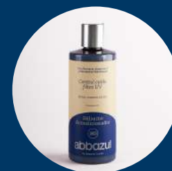
Acondicionador - Él