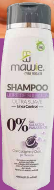
Shampoo Libre de Sulfatos 450ml REF. 21109 / $31.500

Remueve los residuos químicos e impurezas. Limpia profundamente el cuero cabelludo, preparándolo para un tratamiento posterior. Ideal para cuero cabelludo graso.