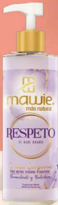
Crema corporal Respeto 250ml REF.21644 $22.900