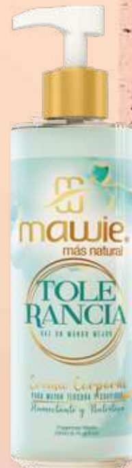
Crema corporal Tolerancia 250ml REF.21645 $22.900