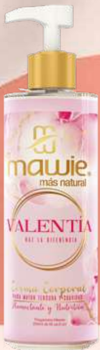
Crema corporal Valentía 250ml REF.21646 $22.900

Humecta tu piel con las nuevas cremas corporales mawie el complemento perfecto de nuestros splash. Juntos te brindarán la mejor experiencia de suavidad, frescura e hidratación.