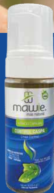
Tónico capilar control caspa 150ml REF. 21281 / $38.900

Nuestro Shampoo ultra suave contiene colágeno y coco. El colágeno para el cabello es la clave para tener un crecimiento sano y fuerte, además de brillante y grueso. El coco hidrata, protege, revitaliza el cabello y lo nutre a profundidad. Especial para cuero cabelludo sensible y delicado.