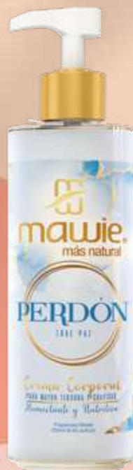
Crema corporal Perdón 250ml REF.21643 $22.900