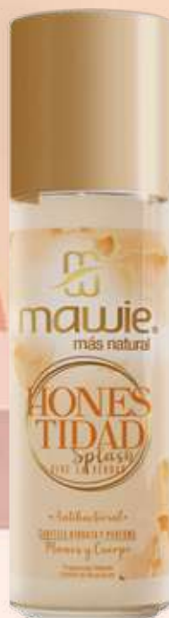
Splash Honestidad 250ml REF.21007 $28.900