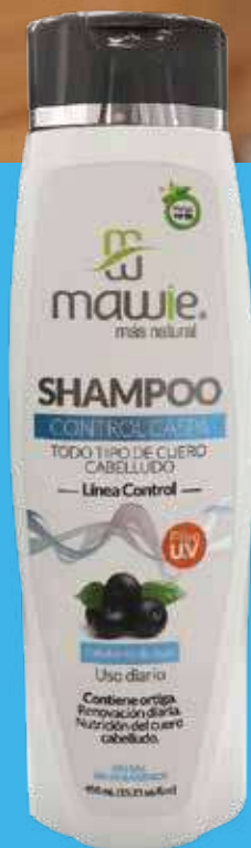
Shampoo Control Caspa - 450ml REF. 21240 / $31.500

Concentrado de activos naturales que combaten la caspa desde su origen, contiene exfoliante de azaí y coco que purifica, nutre y renueva el cuero cabelludo. Ideal para todo tipo de cabello.