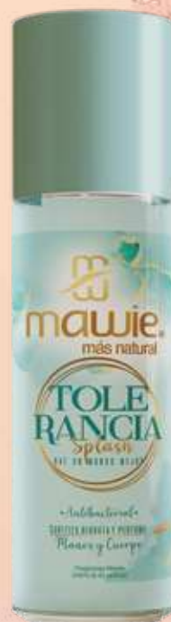
Splash Tolerancia 250ml REF.21010 $28.900