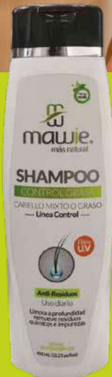
Shampoo Control Grasa 450ml REF. 21239 / $31.500

Concentrado de activos naturales que combaten la caspa desde su origen, contiene exfoliante de azaí y coco que purifica, nutre y renueva el cuero cabelludo. Ideal para todo tipo de cabello.