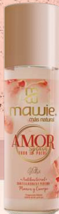
Splash Amor 250ml REF.21012 $28.900