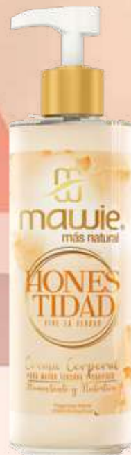
Crema corporal Honestidad 250ml REF.21642 $22.900