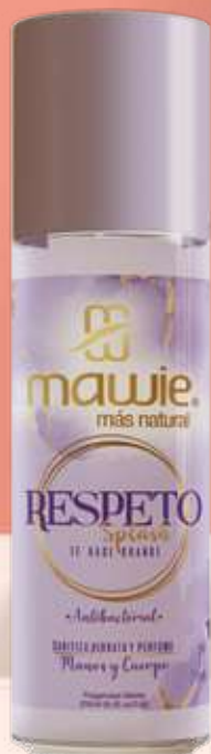
Splash Respeto 250ml REF.21008 $28.900