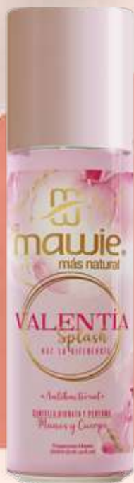
Splash Valentía 250ml REF.21009 $28.900

Refresca y llena tu vida de aromas relajantes y armoniosos . Disfruta de un valor cada día y siente como tu ambiente cambia y se renueva.