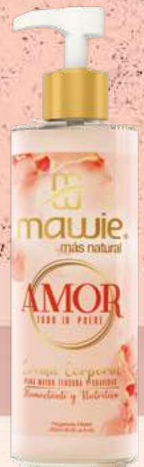
Crema corporal Amor 250ml REF.21641 $22.900