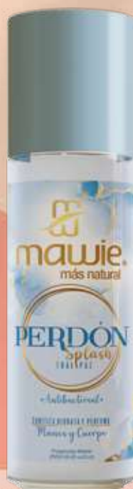
Splash Perdón 250ml REF.21011 $28.900